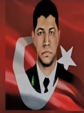
Ömer Halisdemir Astsubay Kıdemli Başçavuş